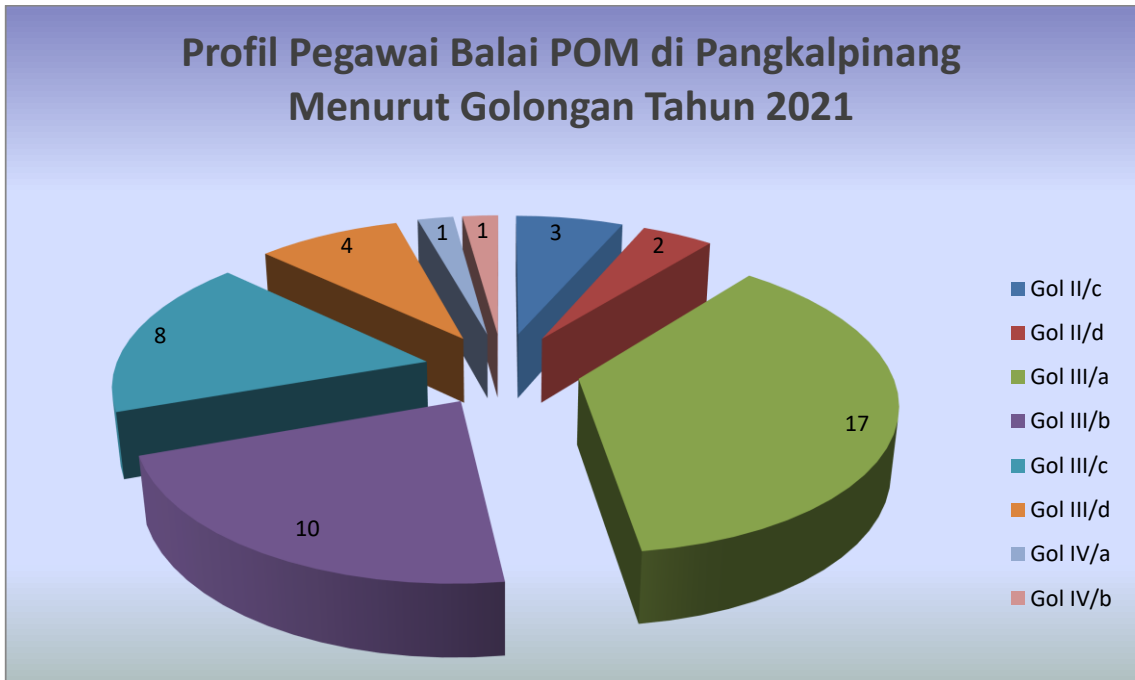
Gambar 1.3. Profil Pegawai Balai POM di Pangkalpinang berdasar Golongan Tahun 2021