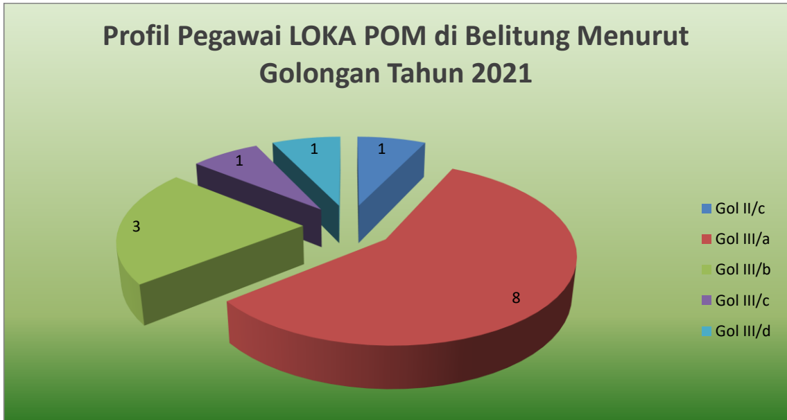
Gambar 1.4. Profil Pegawai LOKA POM di Belitung berdasar Golongan Tahun 2021