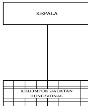
Gambar 1.2 Struktur Organisasi Loka POM di Kabupaten Belitung