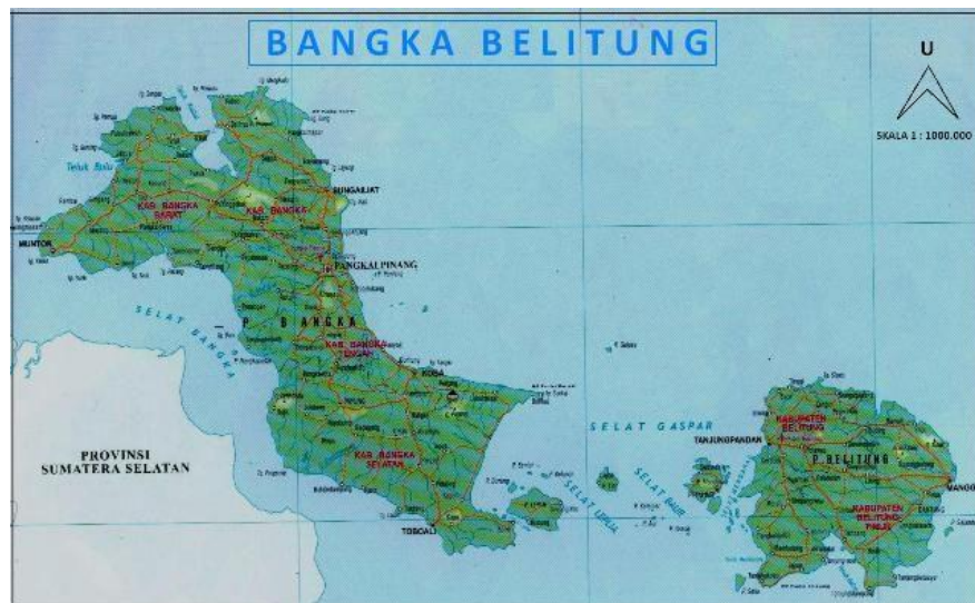
Gambar 1.5 Peta Provinsi Kepulauan Bangka Belitung

Wilayah Provinsi Kepulauan Bangka Belitung memiliki luas 18.725,14 km 2 , dimana sebagian besar merupakan wilayah perairan mencapai 79,90%.